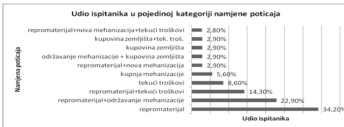
Grafikon1. Udio ispitanika u pojedinoj kategoriji namjene poticaja

Zanimljivo je istaknuti da su se apsolutno svi proizvođači izjasnili da imaju koristi od državnih poticaja, a sredstva su upotrijebili najviše za nabavu repromaterijala (34,3%), kombinaciju nabave repromaterijala i održavanja postojeće mehanizacije (22,9%), kombinaciju nabave repromaterijala i tekućih troškova, tj. rate kredita ili režije (14,3%) i dr., prikazano u Grafikonu 1.